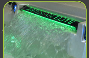
1 LED WASSERFALL