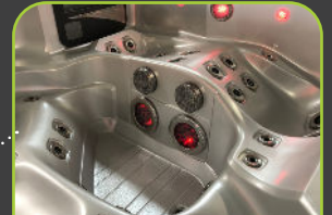
2 LED FOOTBLASTER™