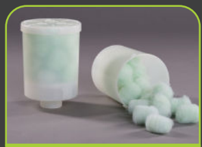
EGO 3 FILTERSYSTEM