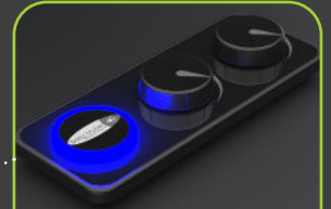
5 DIRECT FLOW™