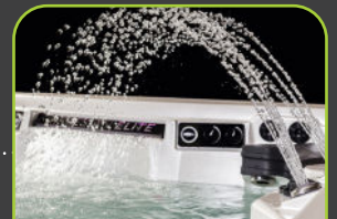
4 LED FONTAINEN